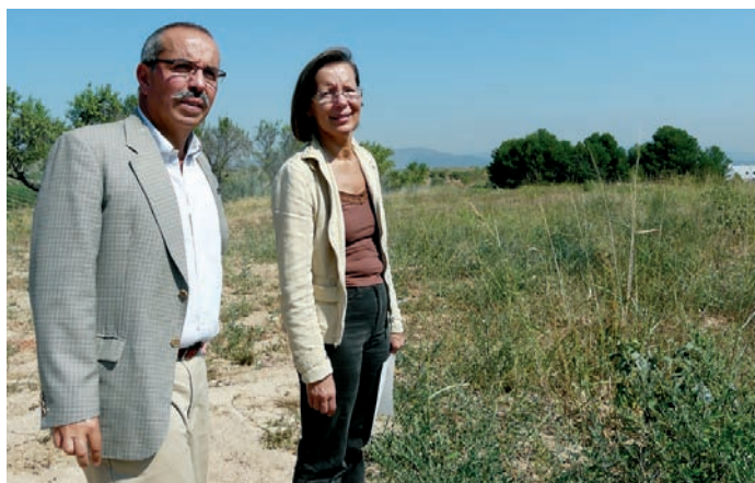
Baiget i Tura, al solar de Sant Joan Samora que es convertirà en presó.

L'equipament estarà situat sobre 164.134 metres quadrats del paratge conegut com a Can Cànoves, a prop del nucli de Sant Joan Samora.