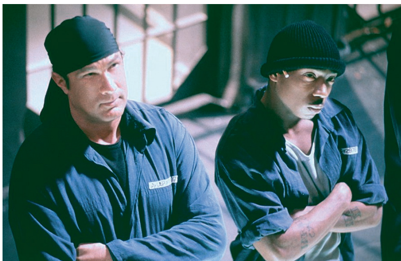
Steven Seagal i Morris Chestnut a "Hora de morir".

17:00 (Pl. Germans Trillas) DONACIÓ de Sang. Fins a les 21 hores.