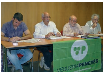
Membres de la Plataforma per una Vegueria Pròpia.