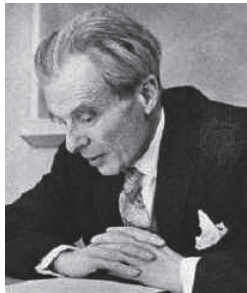
Mor el novel·lista britànic Al-dous Leonard Huxley.