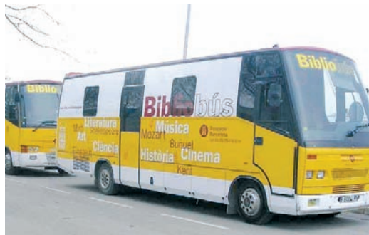
Aquests dies els bibliobusos Montau i El Castellot porten pels pobles una campanya de foment de la lectura.

18:30 (Casa de Cultura) TALLER de tast de vins. Fins a les 21.30. Cal inscripció prèvia.